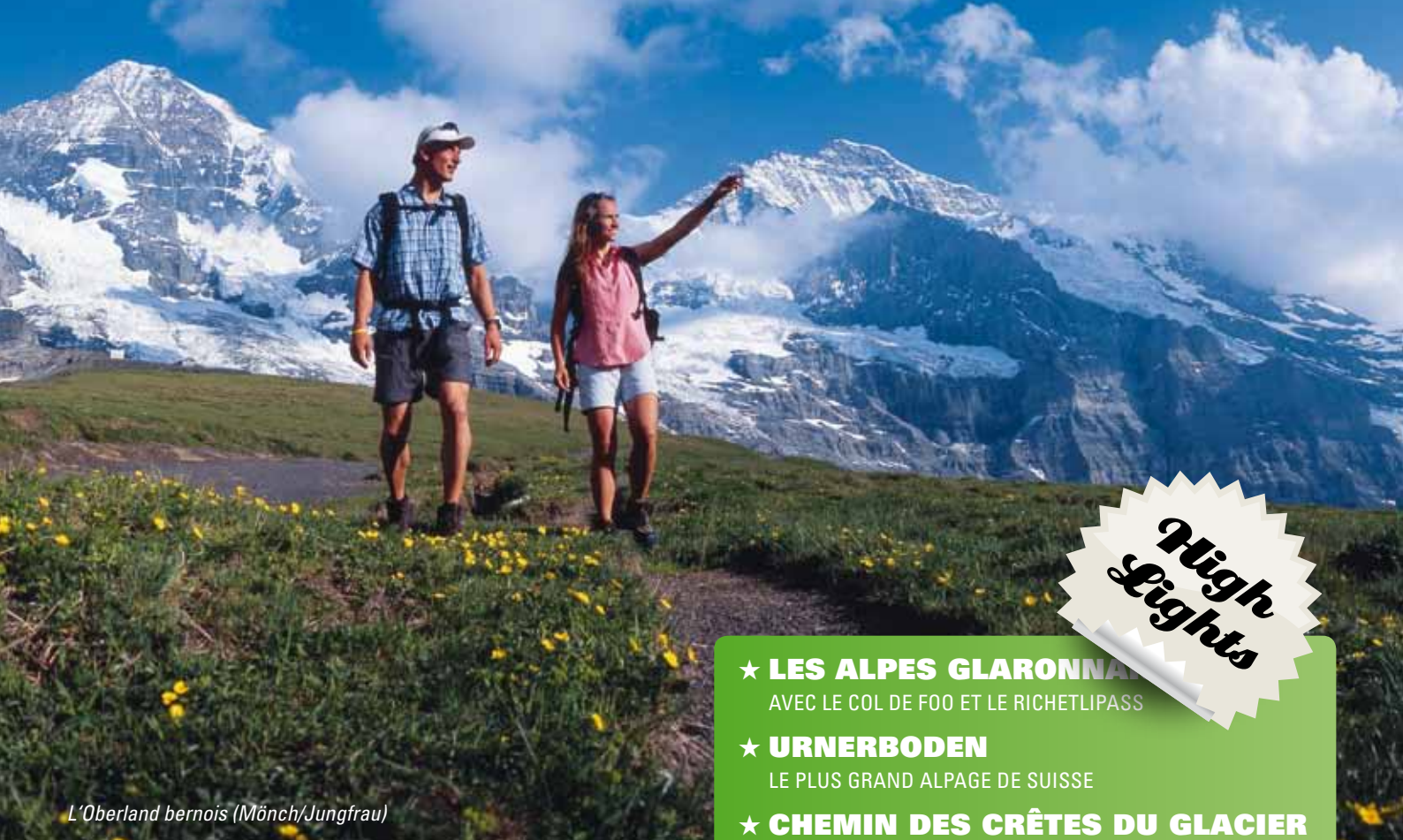
L'Oberland bernois (Mönch/Jungfrau)