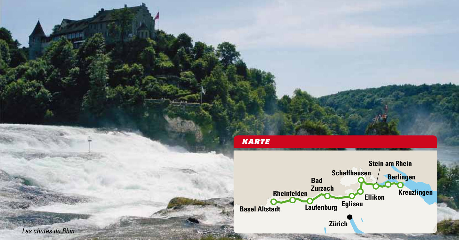
Les chutes du Rhin