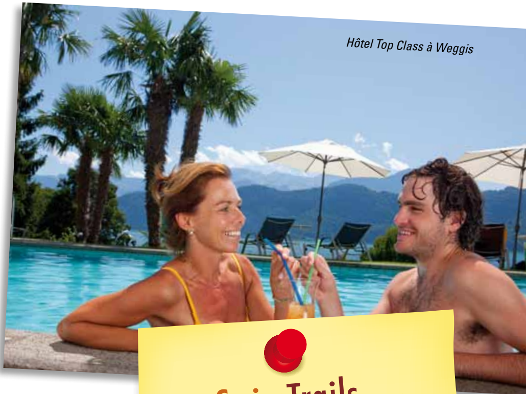
Hôtel Top Class à Weggis

15.04. - 15.10.2012 (départs quotidiens)