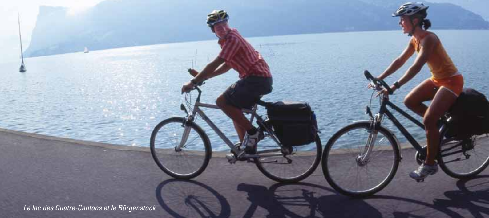
Le lac des Quatre-Cantons et le Bürgenstock

LUCERNE LUZERN DIE STADT. DER SEE. DIE BERGE.