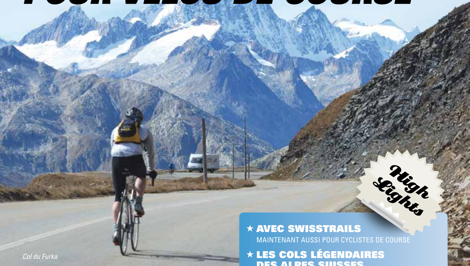
Col du Furka