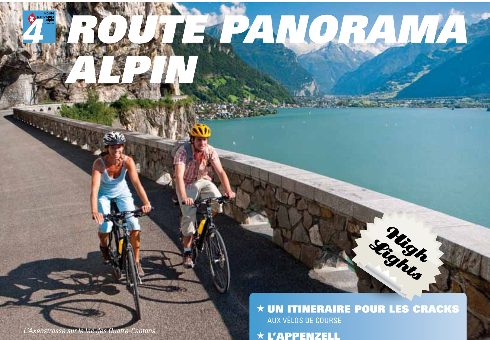
L'Axenstrasse sur le lac des Quatre-Cantons