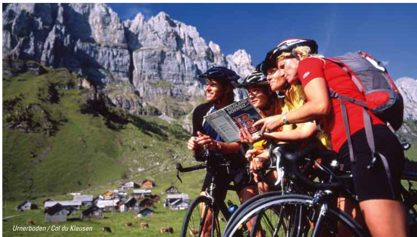
Urnerboden / Col du Klausen

15.05. - 15.10.2012 (départs quotidiens)