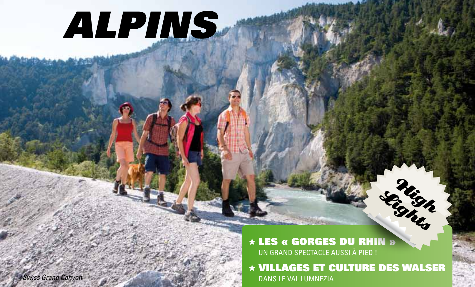
Swiss Grand Canyon