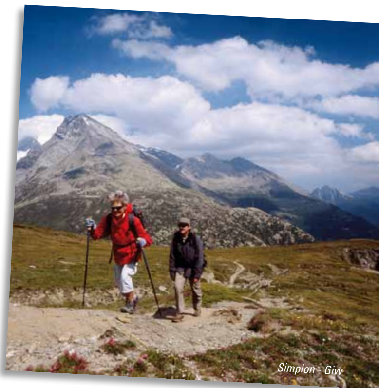
Simplon - Giv

15.06. - 30.09.2012 (départs quotidiens)