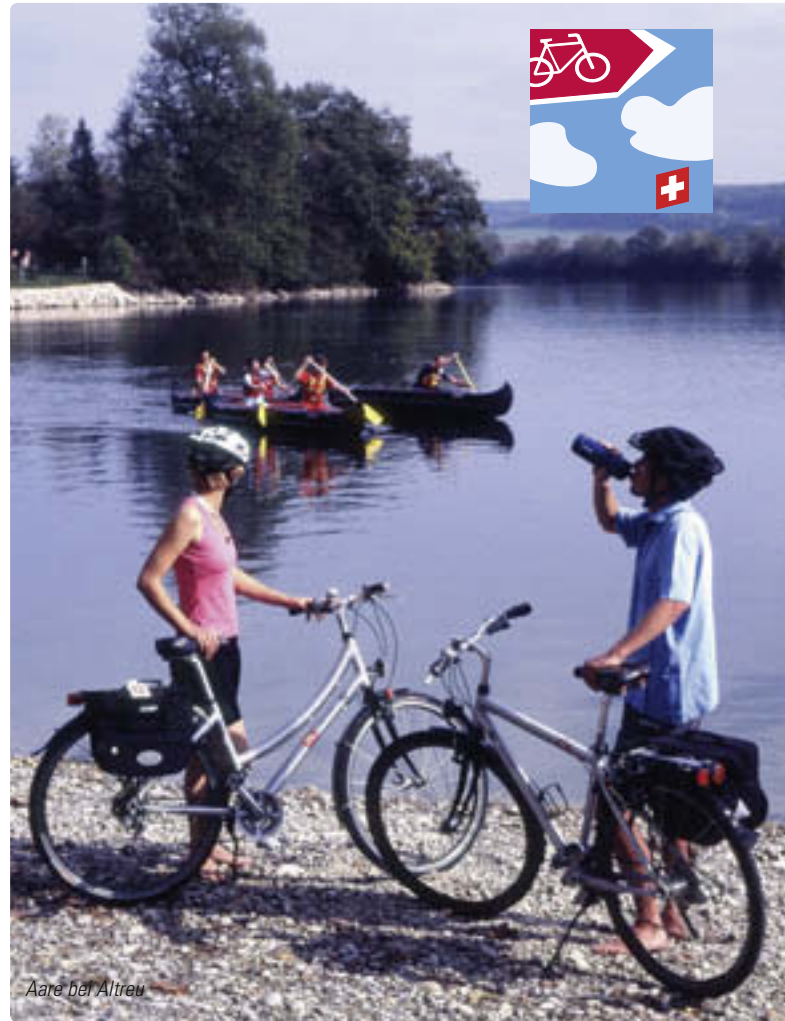
Aare bei Altreu

Die Route folgt meist direkt dem Aarelauf und erreicht nach Brugg das «Wasserschloss» der Schweiz, wo sich die drei Flüsse Limmat, Reuss und Aare vereinigen